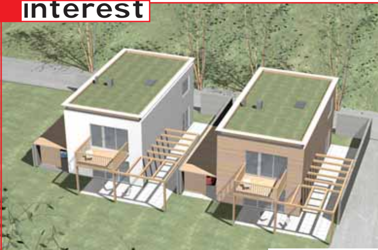
„Weingartenallee“ von Walter Stelzhammer: geradlinig und offen