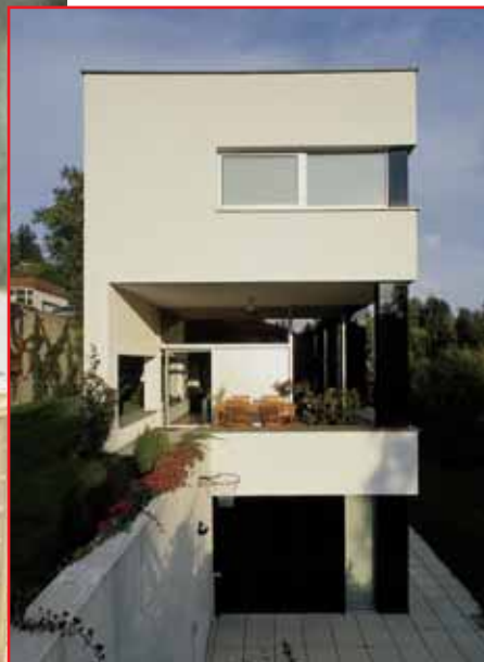
Projekt bei Wien: Hanglage kunstvoll ausgenützt