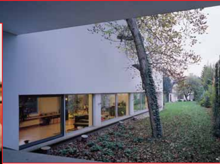
Ausbauprojekt „Villa B*“ in Wien